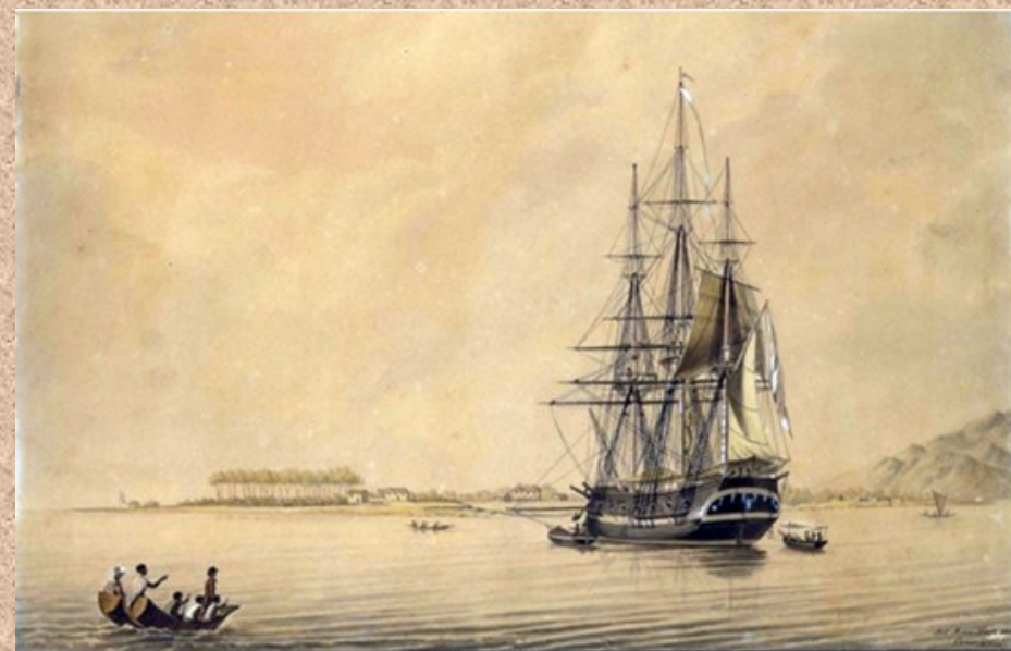
La corvette La Coquille au mouillage, vue de la Pointe Vénus, à Matavai, île de Taïti.

Découvreur de la Vénus de Milo à 30 ans, il a, par la suite, réalisé 3 tours du monde scientifiques (le seul, avec Cook), de 1821 à 1839, retrouvé les navires naufragés de La Pérouse, initié le protectorat français sur la Polynésie, découvert la Terre Adélie, avant de périr tragiquement, avec sa femme et son fils, dans le premier accident de chemin de fer français, entre Versailles et Paris.