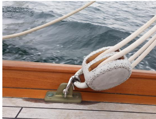
Détails des cap de mouton et poulies