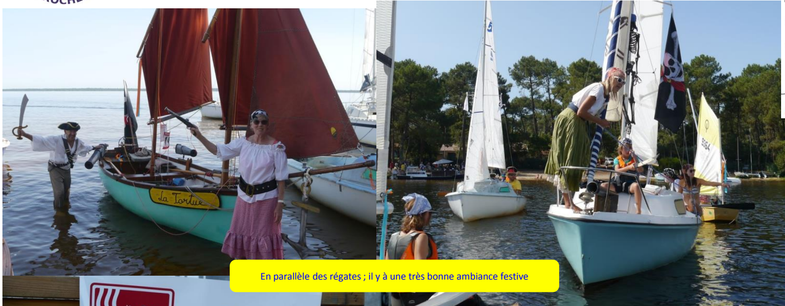
En parallèle des régates ; il y a une très bonne ambiance festive