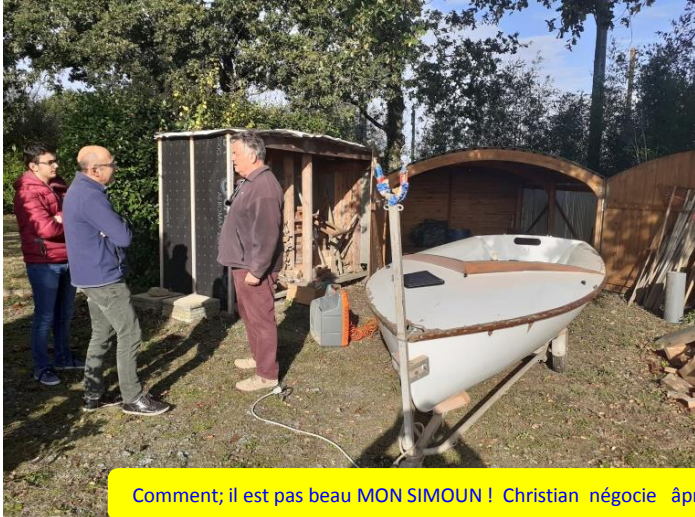
Comment; il est pas beau MON SIMOUN ! Christian négocie âprement !

Don d'un SIMOUN 460 appelé YODI construit en 1963 à la baule au chantier GOUTERON en contreplaqué moulé !