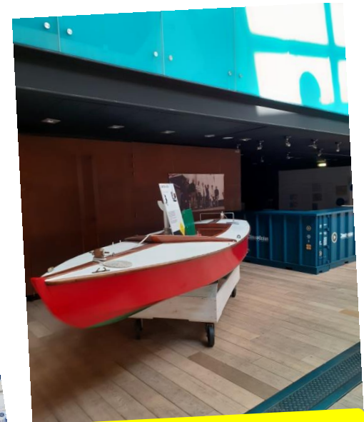
Le caneton Brix retrouve sa place