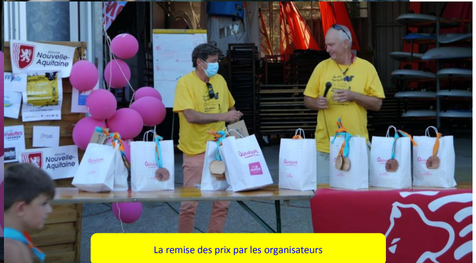
La remise des prix par les organisateurs