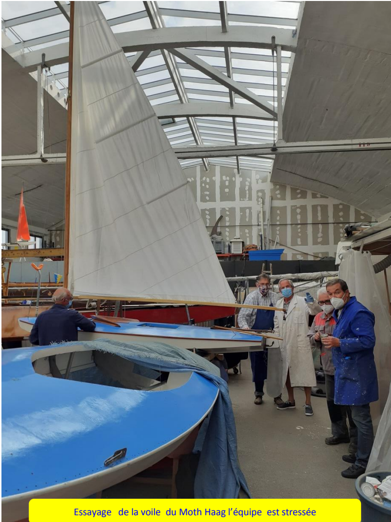
Essayage de la voile du Moth Haag l'équipe est stressée