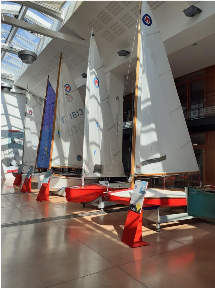
Remise en place de la collection Moth