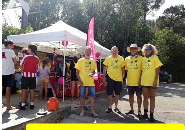
Les deux équipages PPL après les inscriptions