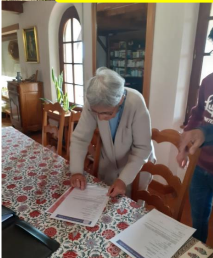
La propriétaire signe l'acte de donation