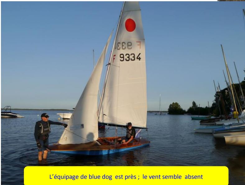
L'équipage de blue dog est près ; le vent semble absent