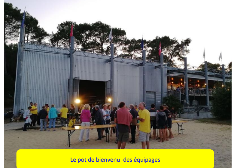
Le pot de bienvenu des équipages