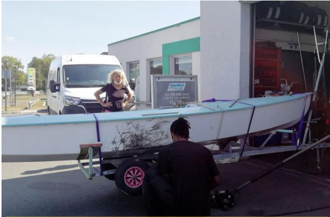
L'équipage du Snipe à connu des problèmes de pneus sur l'autoroute nécessitant un arrêt aux stands!