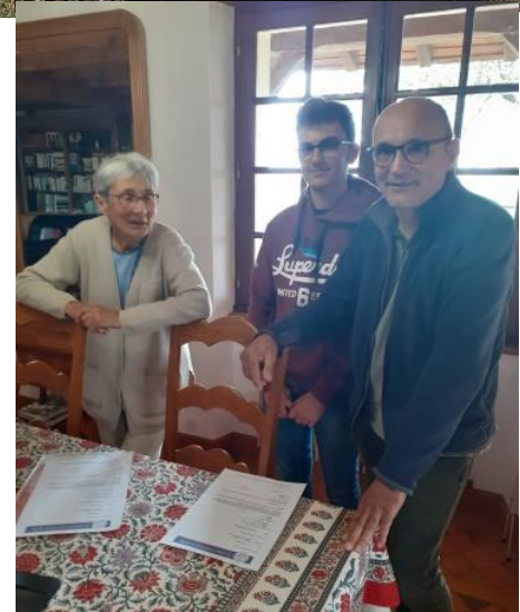
Trois générations de la famille Gaboriau