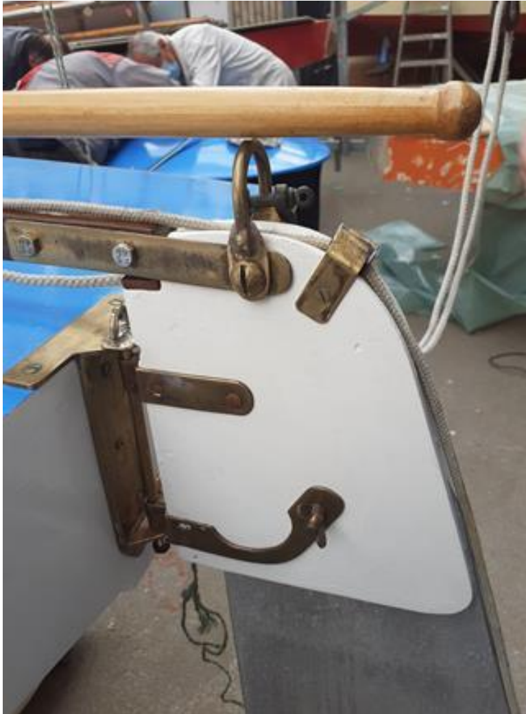
Détails des ferrures de fixation du Safran