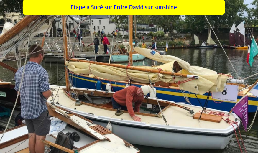
Etape à Suced sur Erdre David sur sunshine