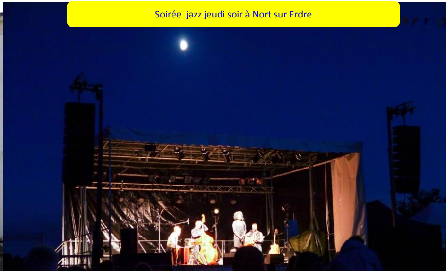
Soirée jazz jeudi soir à Nort sur Erdre