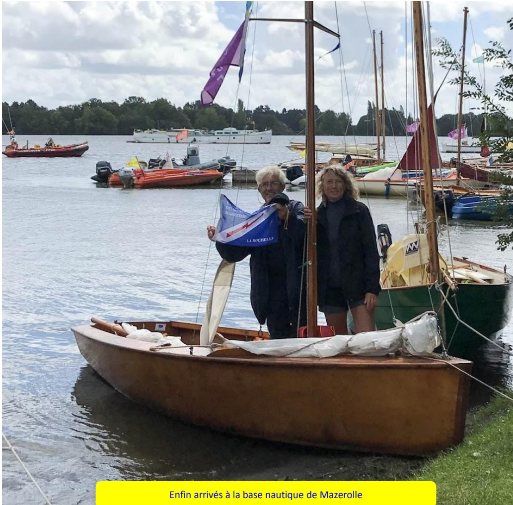
Enfin arrivés à la base nautique de Mazerolle