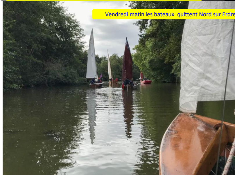
Vendredi matin les bateaux quittent Nort sur Erdre pour le port du Moulon et la plaine de Mazerolle ambiance paisible