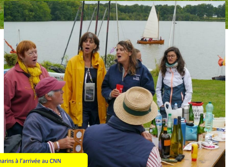
Ambiance musicale et chants de marins à l'arrivée au CNN