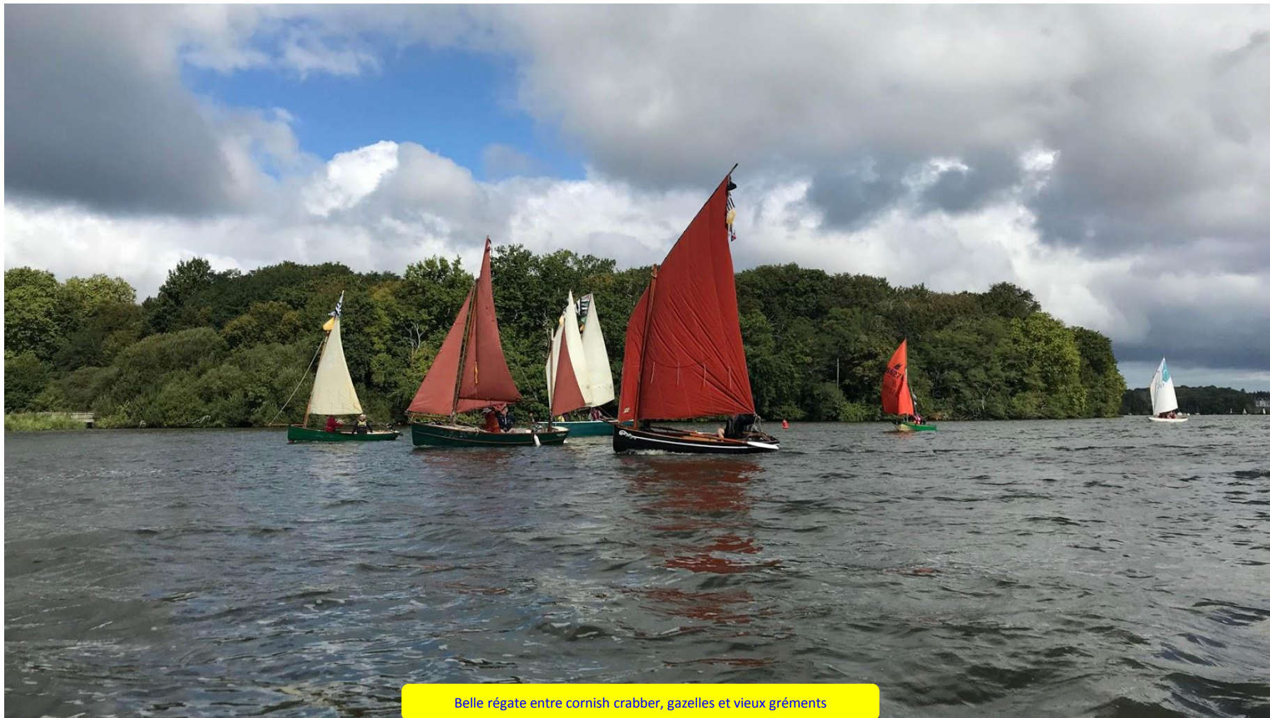
Belle régate entre cornish crabber, gazelles et vieux gréments