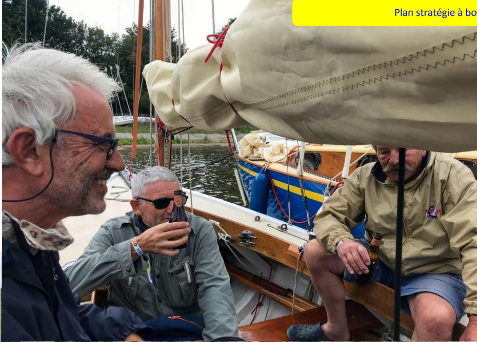
Plan stratégique à bord de sunshine