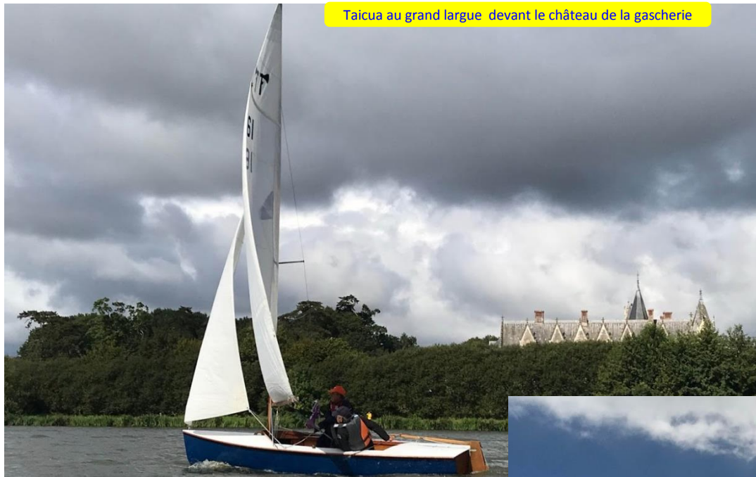
Taicua au grand largue devant le château de la gascherie