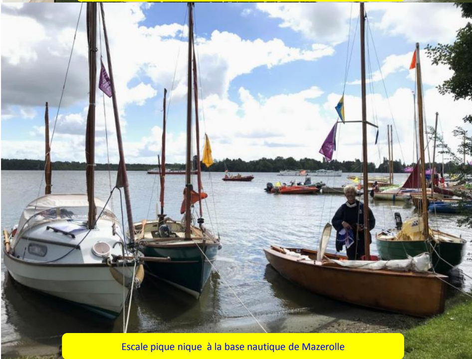
Escale pique nique à la base nautique de Mazerolle