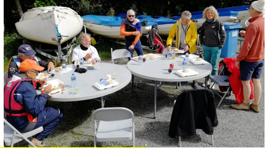
Halte pique nique à la base nautique de La Chapelle sur Erdre.... La distanciation est respectée!