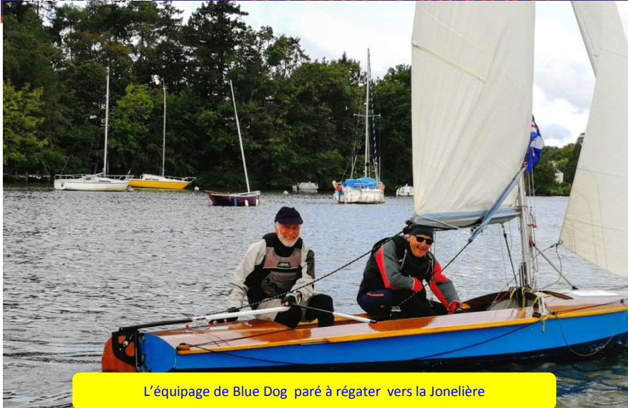
L'équipage de Blue Dog paré à régater vers la Jonelière