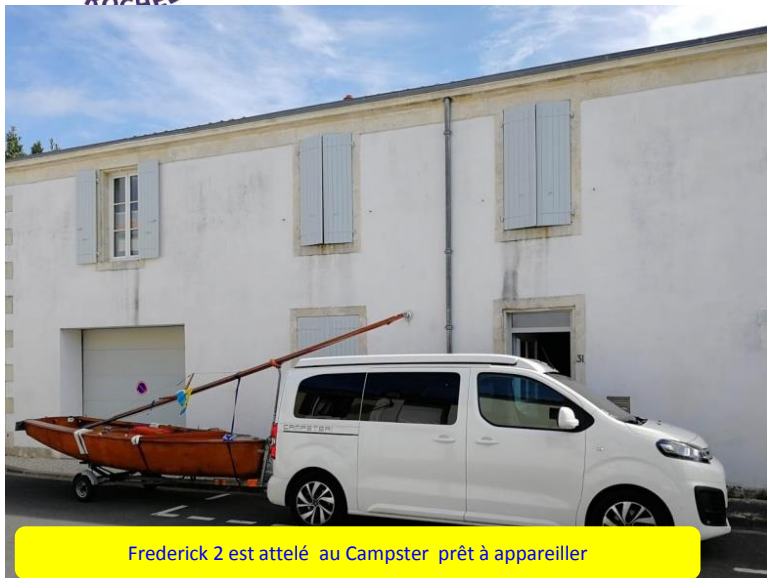
Frederick 2 est attelé au Campster prêt à appareiller