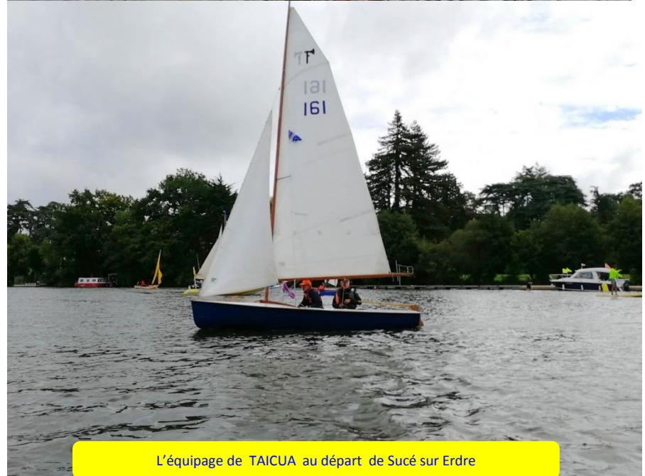
L'équipage de TAICUA au départ de Sucé sur Erdre