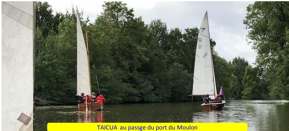
TAICUA au passage du port du Moulon