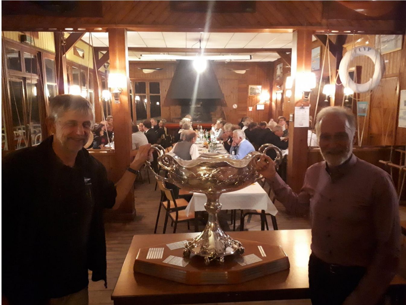
L'équipage de « Blue Dog » fiers de ses performances et de pouvoir porter ce trophée historique.