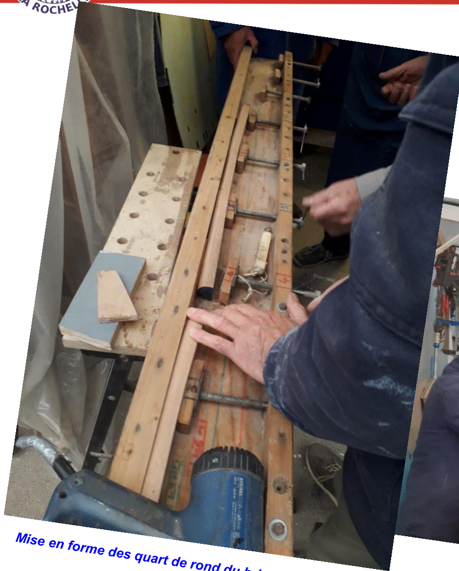
Mise en forme des quart de rond du brise lame