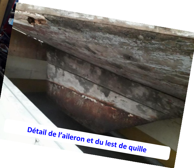
Détail de l'aileron et du lest de quille