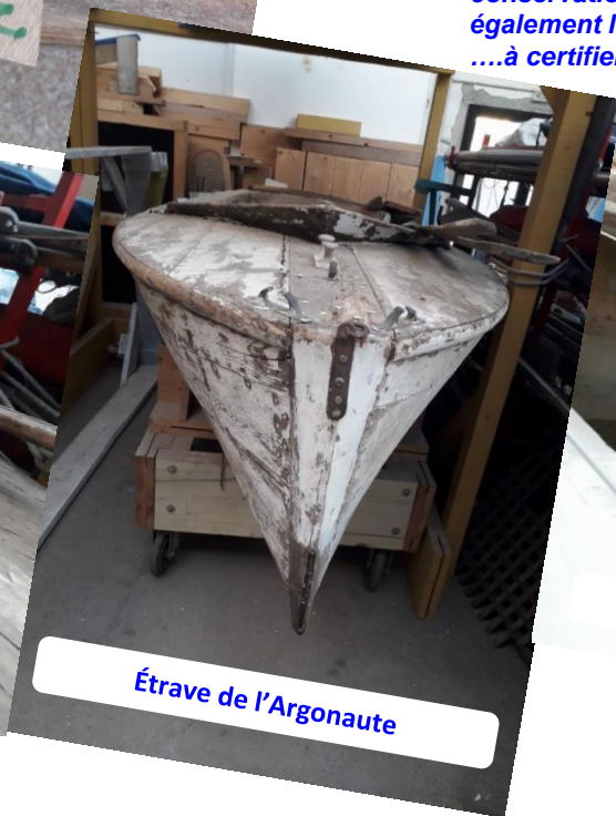
Étrave de l'Argonaute