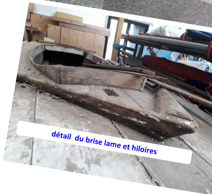
détail du brise lame et hiloires