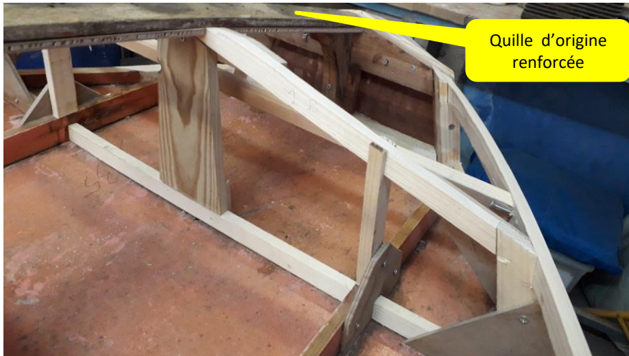
Quille d'origine renforcée