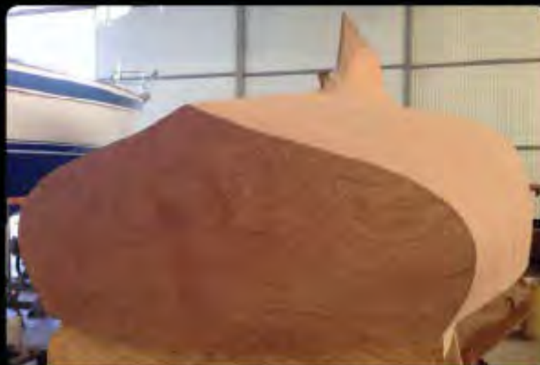
Y DAMIEN en pleines formes