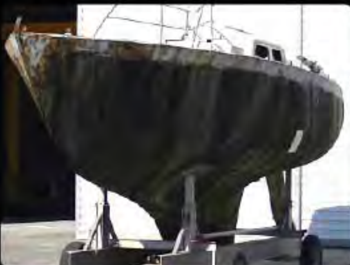
A arrivée au chantier

Tous les équipements intérieurs et extérieurs sont récupérés, inventoriés et stockés par une équipe motivée des Amis du Musée. Les appendices : safran, lest, ... sont démontés et la coque mise en préparation pour le chantier. L'approvisionnement de l'acajou tranché 5mm pour la restauration de la coque est lancé.