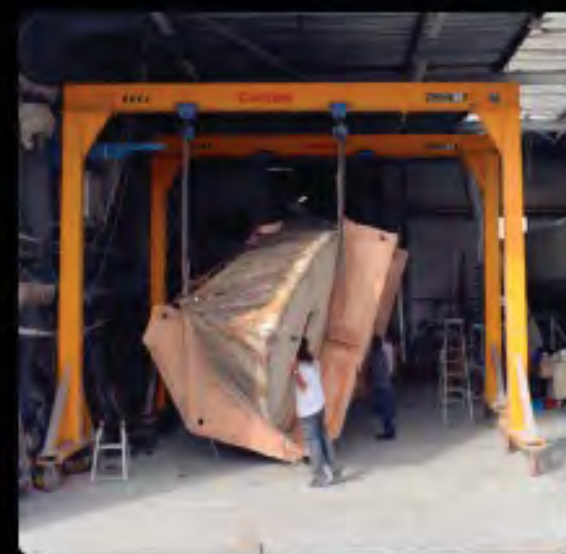
G ça tient!