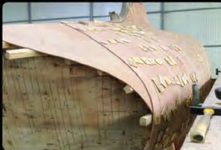
S 2ème pli croisé