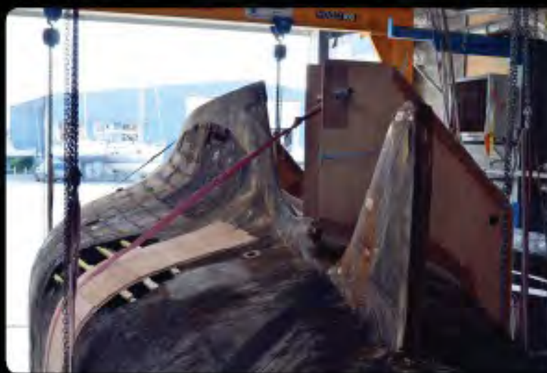
I prêt pour le départ