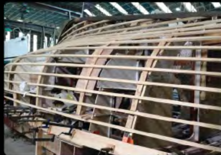
N remplacement des bauquères