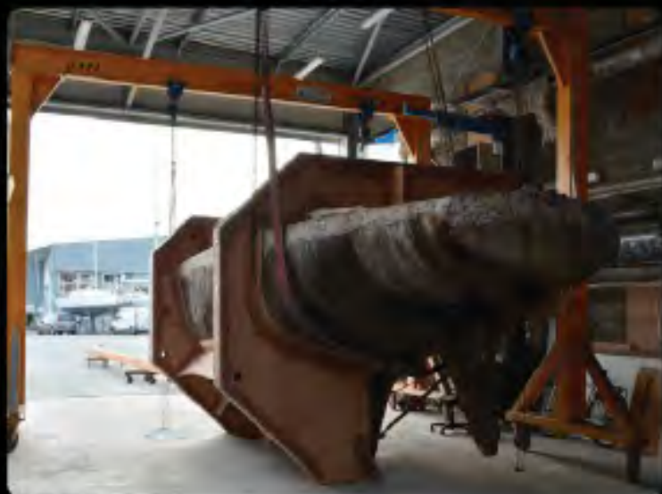
E bien calé dans son ber de travail

Le premier travail consiste à construire un ber spécial autour de la coque pour éviter les déformations et avant d'effectuer le retournement du bateau, sans risque pour la structure. Des renforts sont également positionnés à l'intérieur de la coque pour plus de sécurité.