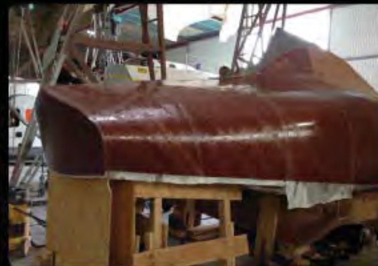
Z un imper sur mesure pour le Grand Pavois