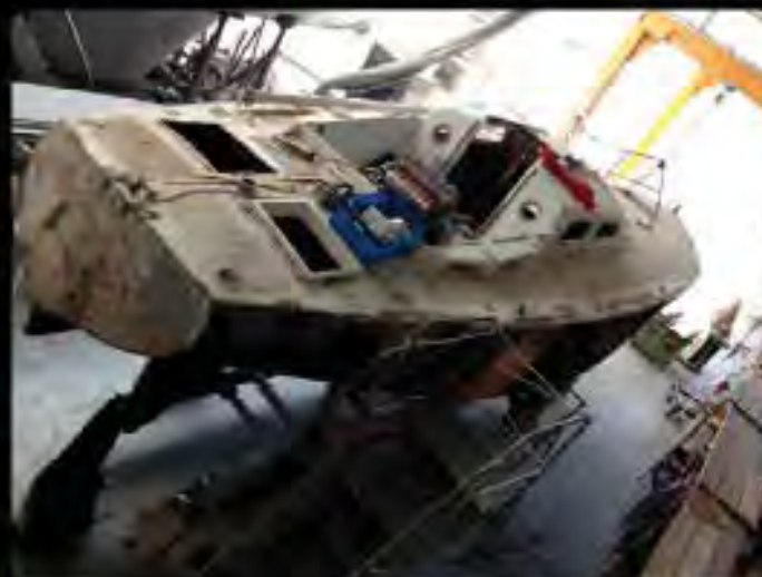
B démontage des équipements