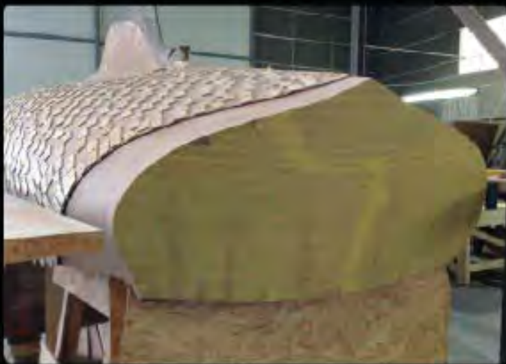
U tableau arrière rhabillé