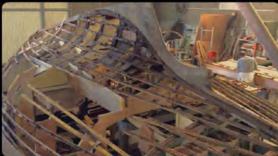
M remplacement des lisses, une par une