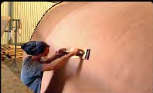
X poncer la coque