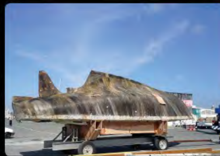
J en route pour la restauration de la coque