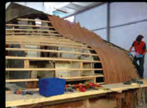
Q ...et patience