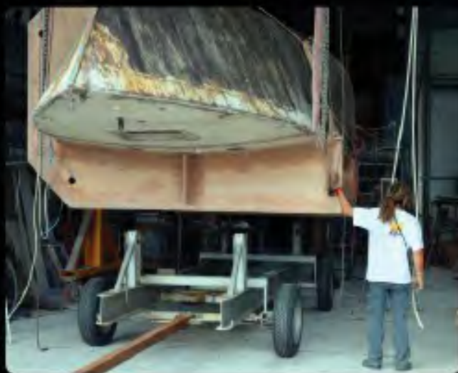
H chavirage réussi