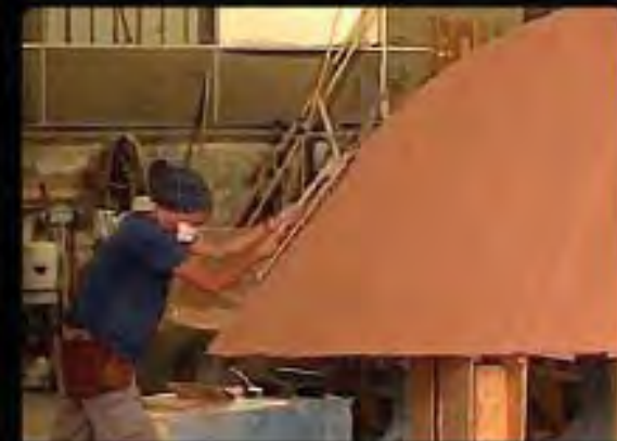
W poncer l'étrave