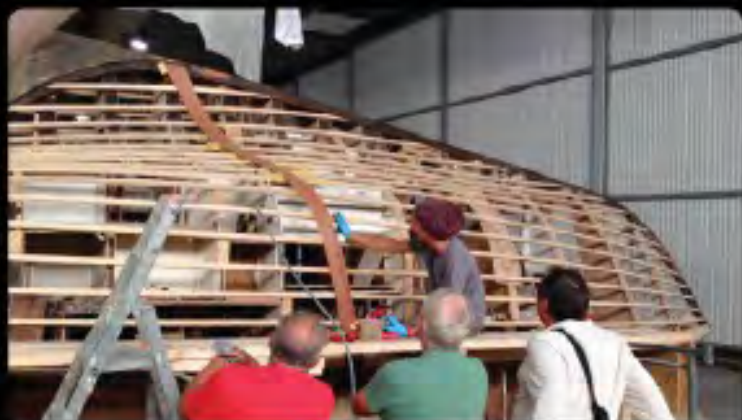
O première latte du 1er pli

La coque prend forme, DAMIEN retrouve son look. Le 3ème et dernier pli est achevé mi-juillet 2015, puis protégé des intempéries par un système résine + tissus de délamination afin d'être présenté au Grand Pavois.