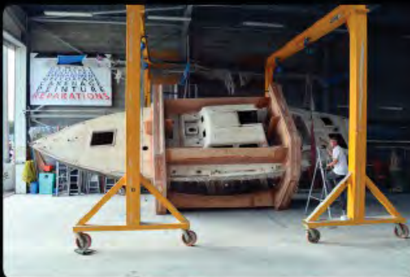
F y'a de la gîte!