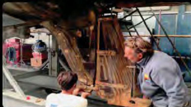
C démontage du safran