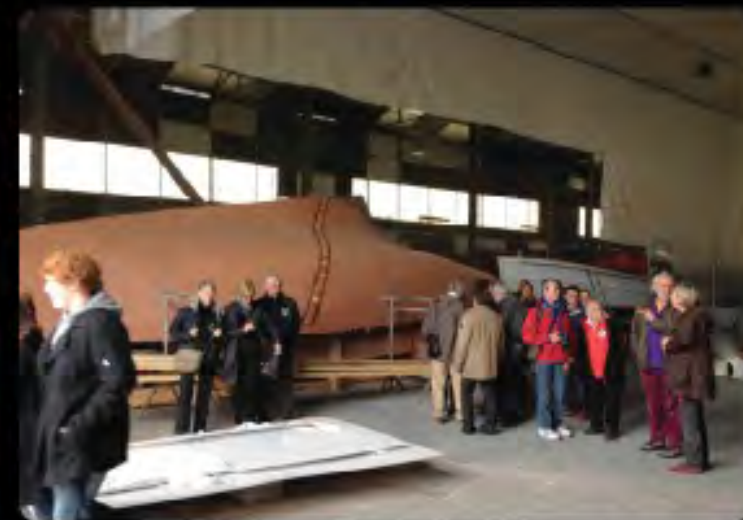
T en route pour le 3ème pli