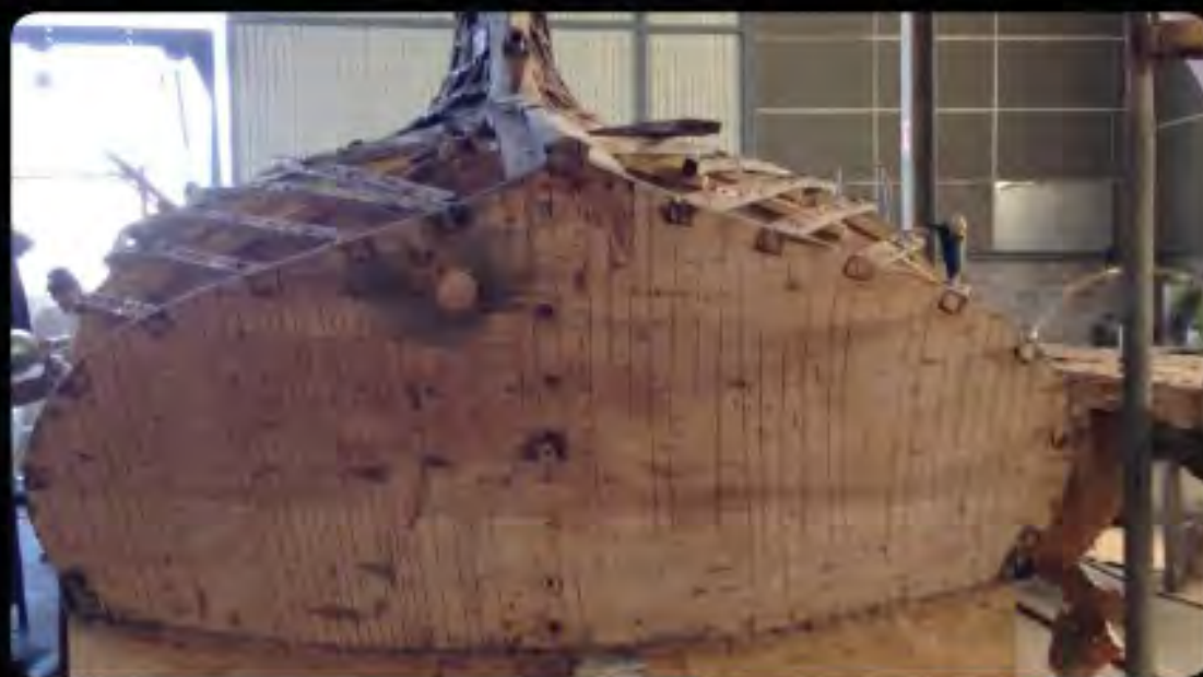
L tableau arrière à nu