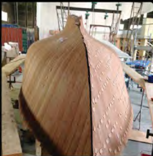
R la coque reprend forme