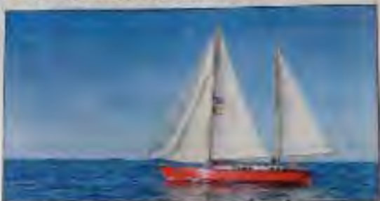
▲ Les architectes de la navigation au long-cours, écrit sous pendant cette quinzaine