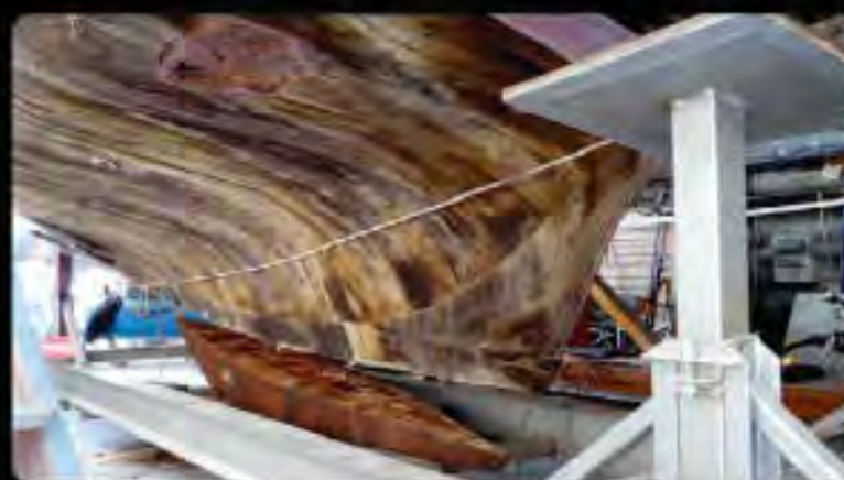
D dépose du lest en fonte