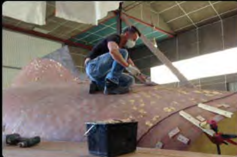
V ôter les cales