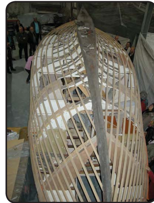
Dominique prend de la hauteur

Les plans sont photographiés pour un projet collectif de maquette ... ; et ils seront numérisés pour la banque de données du Musée.