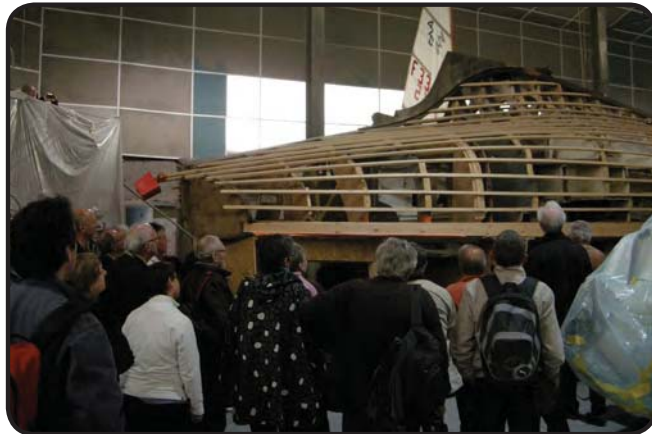
30 visiteurs passionnés