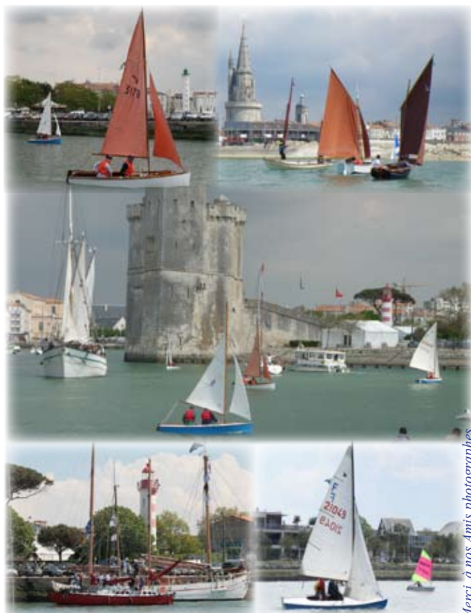
Merci, à nos Amis photographes

L a semaine du Nautisme est terminée, nous pouvons donc tirer un premier bilan.