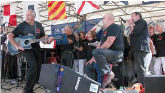
Les ateliers vocaux et instrumentaux en représentation lors des dernières journées du patrimoine

Dans le Sud-Ouest du 30 janvier dernier, on pouvait lire : «C'est le moment de chanter... Des chercheurs allemands ont démontré que le chant agirait comme antistress et rendrait de bonne humeur...». La bonne cinquantaine de chanteurs qui viennent régulièrement aux répétitions de l'atelier peuvent le confirmer : le chant pratiqué en groupe élimine le stress, chasse les idées noires, met de bonne hu-