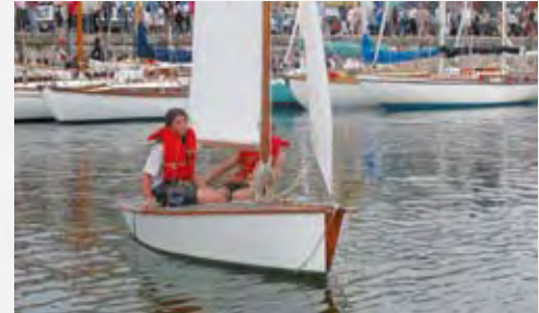
Un Simplex de la collection des amis, monté par de jeunes équipiers, évolue devant la flotte des yachts classiques. Grands ou petits, les bateaux du patrimoine ont leur place au musée

«Il s'appelle Joshua ?»... oui, Joshua , c'est son prénom, devinez pourquoi ?..., un petit bonhomme qui pour ses 2 ans embarque en septembre prochain pour une sortie à la journée dans les Pertuis, avec papa et maman bien sûr, et ses grands parents tout récemment installés dans notre belle région. Trois générations réunies, tous adhérents. Bienvenue les amis. Bienvenue jeune Joshua .