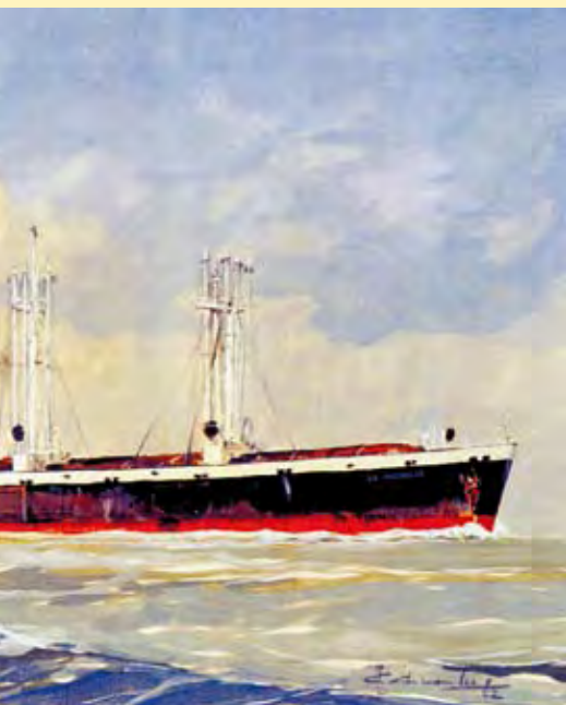
...e, ancien officier de la SNDV qui nous a laissé une autorisation de la famille)