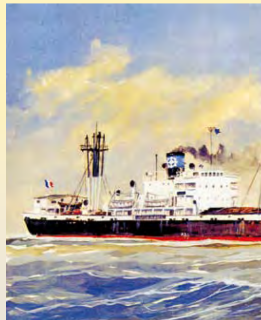
Vue d'artiste du La Rochelle par Zeide Cadinouch, jolie collection de portraits de bateaux.

A la fin de la guerre, dans le cadre de leur programme d'aide, les américains proposèrent aux pays ruinés de reconstituer